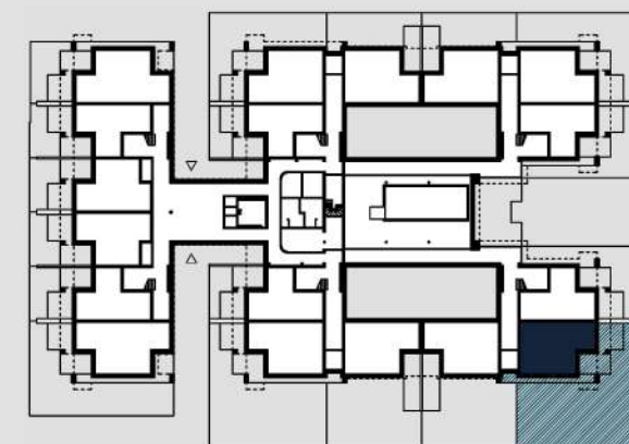
schemat rzutu parteru