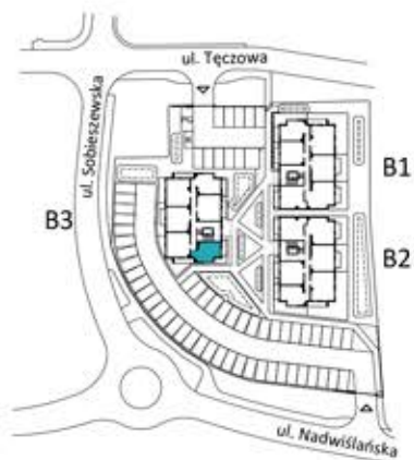
Schemat zagospodarowania terenu Gdańsk, Sobieszewo, ul. Nadwiślańska