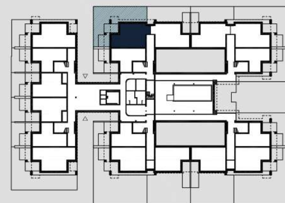
schemat rzutu parteru