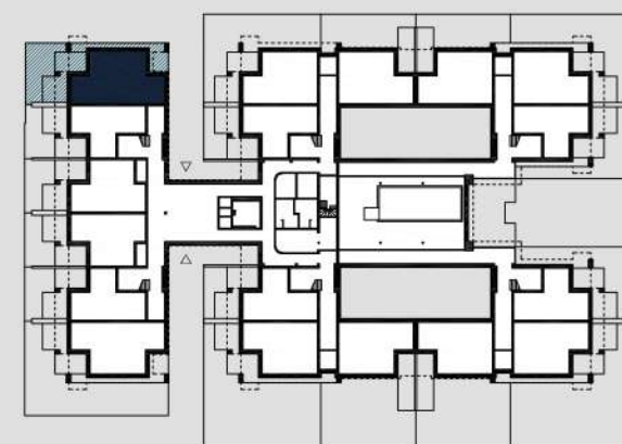
schemat rzutu parteru