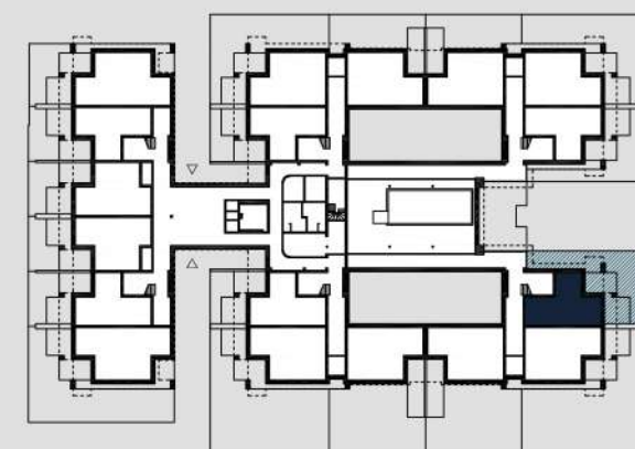
schemat rzutu parteru